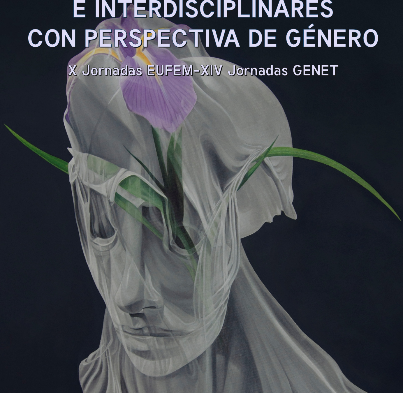
Imagen: Cuadro de flores iris (detalle). Marina Núñez