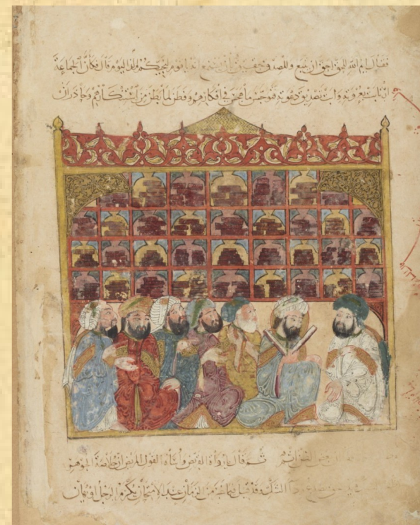
BnF Arabe 5847, f. 5 v (s. XIII)

Centro de Ciencias Humanas y Sociales, CSIC Calle Albasanz 26-28, 28037 Madrid