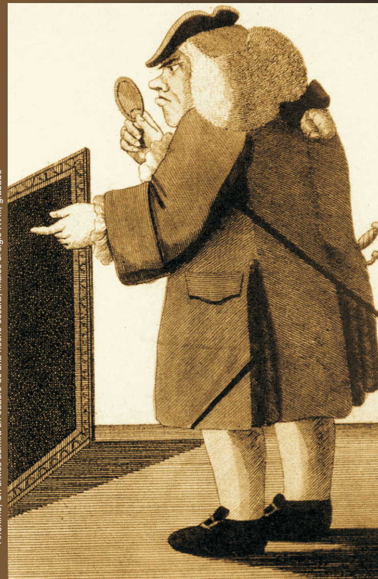
Anónimo, Un crítico admira un cuadro de una noche oscura, finales el siglo XVIII, grabado

Atelier internacional de la crítica de arte: relatos discrepantes International workshop of art criticism: discrepant accounts