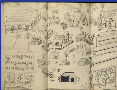
Pueblo granero de Guaxpaltepec, 1730.