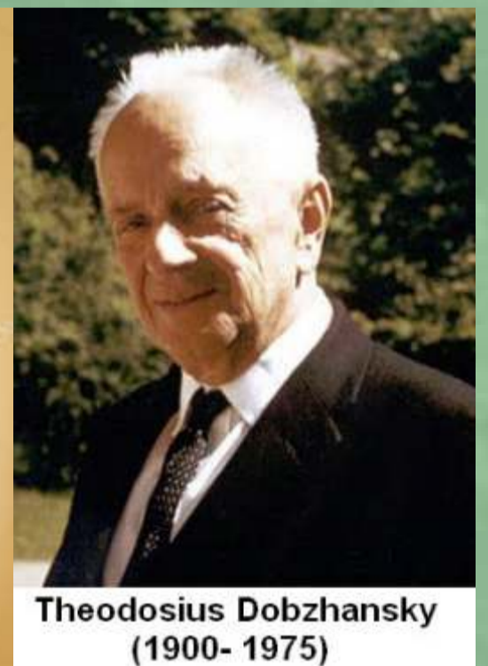
Theodosius Dobzhansky (1900- 1975)

LUNES 21 DE MAYO DE 2018, 12:00H. SALA GÓMEZ-MORENO 2C CENTRO DE CIENCIAS HUMANAS Y SOCIALES, CALLE ALBASANZ 26/28. MADRID 28037